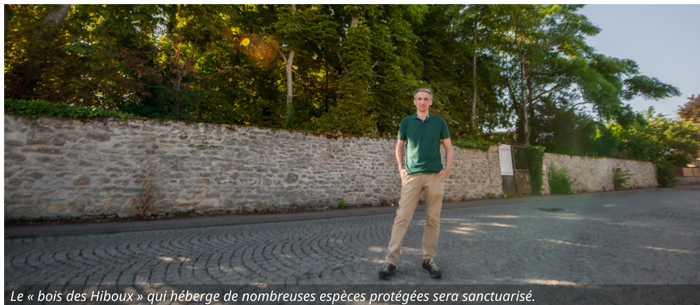
Le « bois des Hiboux » qui héberge de nombreuses espèces protégées sera sanctuarisé.

Enfin, nous protégerons notre environnement exceptionnel , particulièrement nos étangs qui sont négligés depuis bien trop longtemps. Le « bois des Hiboux » qui héberge une faune et une flore extraordinaires a été extrêmement malmené au cours du dernier mandat. Il sera immédiatement sanctuarisé et reclassé en zone protégée.